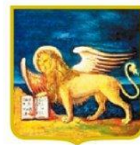
REGIONE DEL VENETO

FONDO SOCIALE EUROPEO IN SINERGIA CON IL FONDO EUROPEO DI SVILUPPO REGIONALE POR 2014 – 2020 – Ob. “Investimenti a favore della crescita e dell’occupazione”