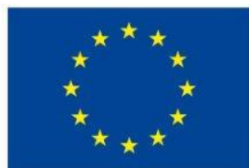
Unione europea Fondo sociale europeo